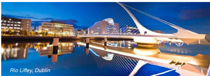
Río Liffey, Dublín