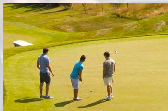
English Plus Golf