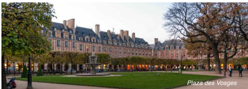
Plaza des Vosges