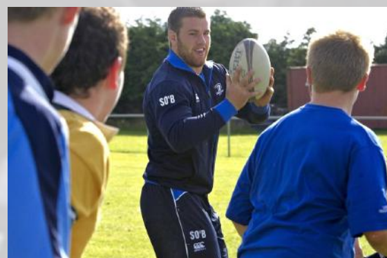
Leinster Rugby Camp