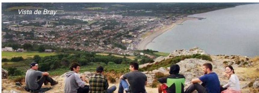
Vista de Bray