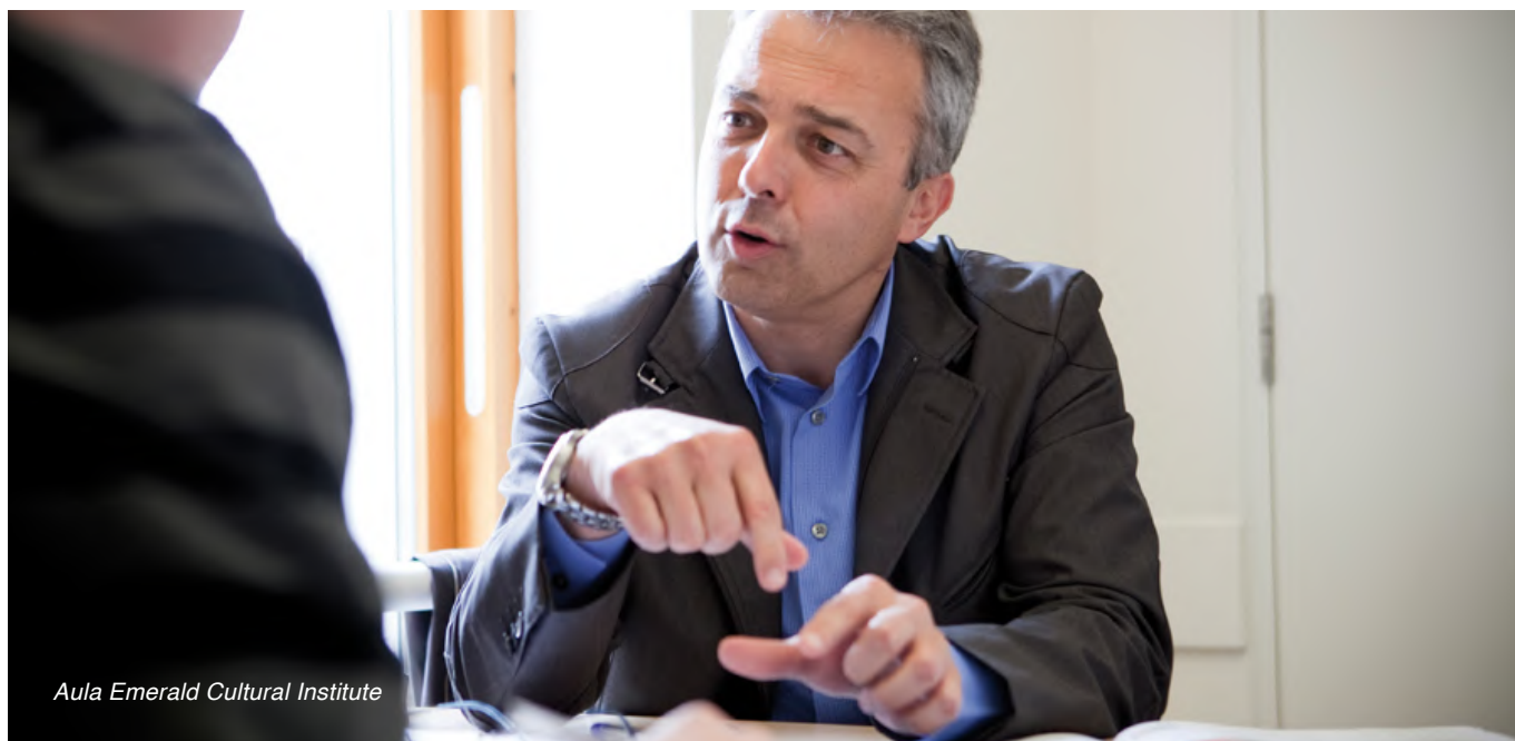
Aula Emerald Cultural Institute