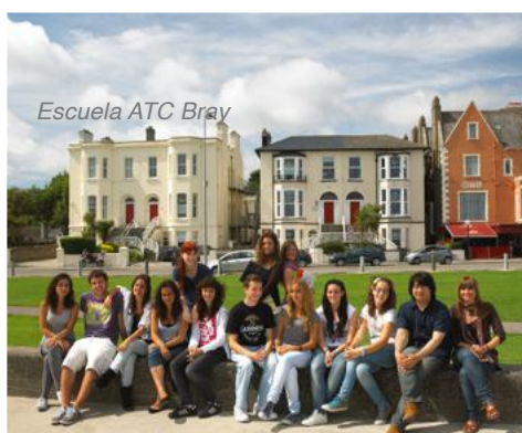
Escuela ATC Bray

ATC se encuentra en la ciudad de Bray. Es una hermosa zona residencial cerca de Dublín. Bray es un destino perfecto para aprender a hablar inglés en contacto permanente con la vida típica irlandesa. Visitar pubs locales, tiendas y la fabulosa playa. A tan sólo 15 minutos de Dublín en DART (tren de cercanías) los estudiantes disfrutaran de la gran metrópoli de Dublín.