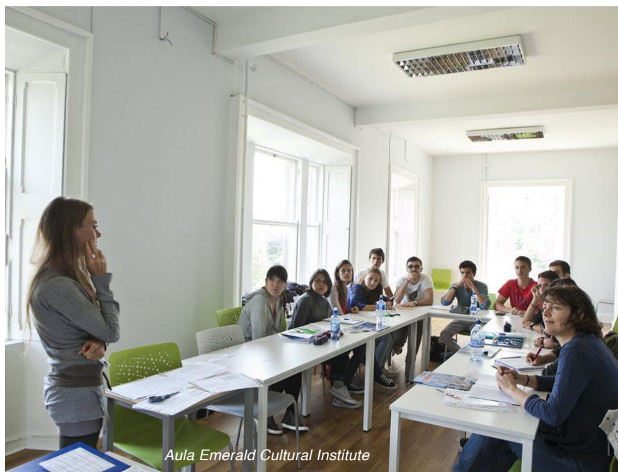
Aula Emerald Cultural Institute