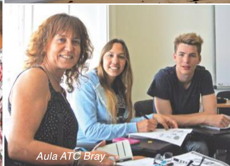
Aula ATC Bray