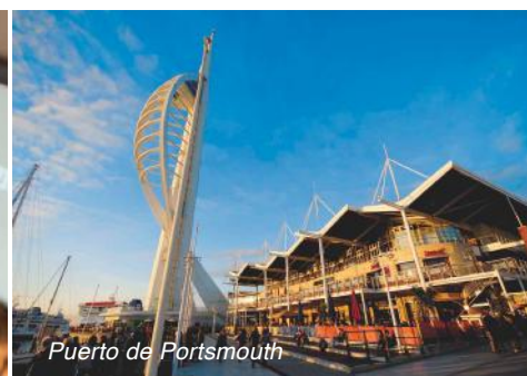
Puerto de Portsmouth