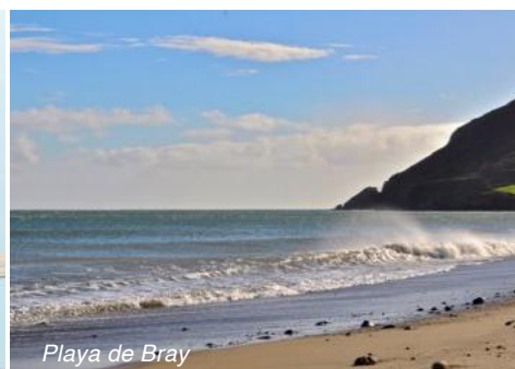
Playa de Bray