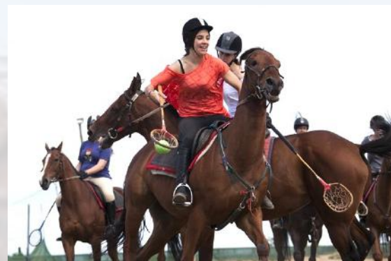
English Plus Horse-riding