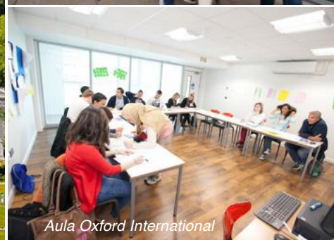
Aula Oxford International