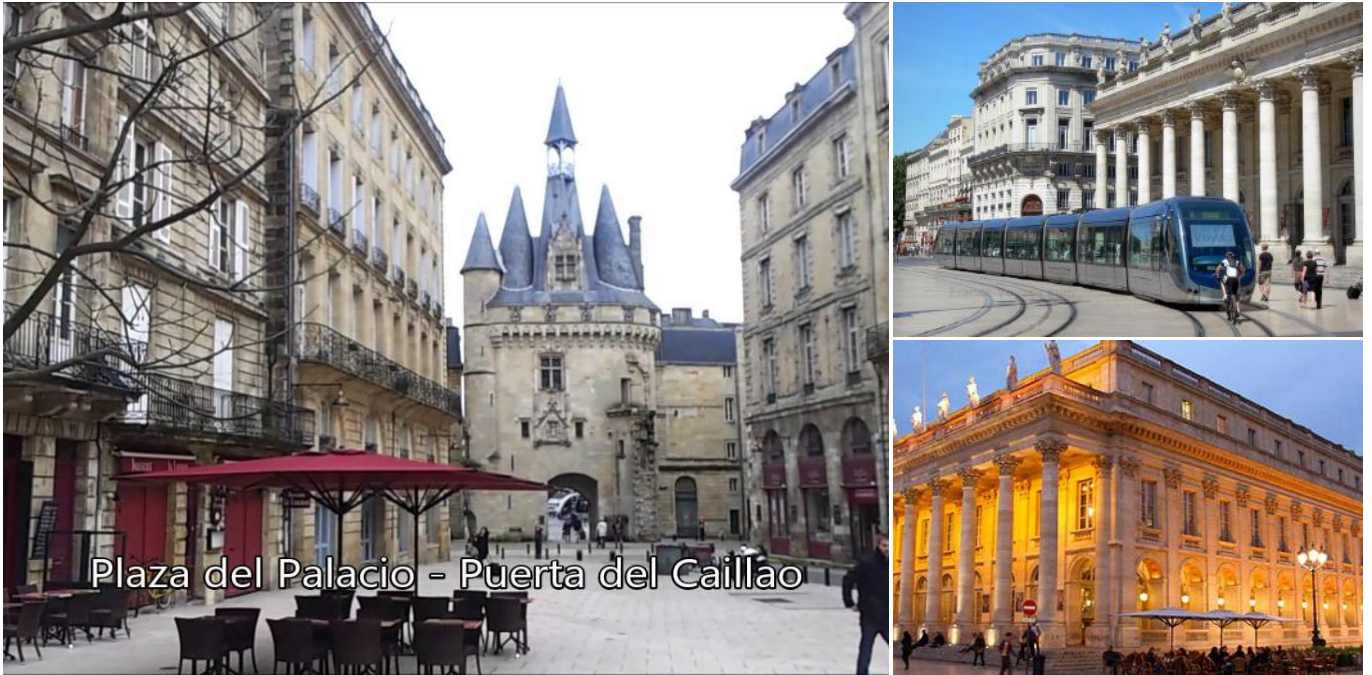
Plaza del Palacio - Puerta del Caillao