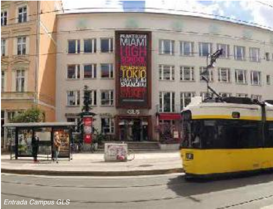
Entrada Campus GLS